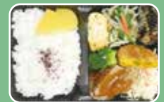
ハンバーグ&かぼちゃコロッケ