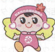
社会福祉協議会マスコット キャラクターつむぎちゃん