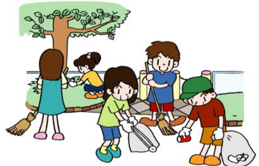
各町会の事業内容(12月末現在)