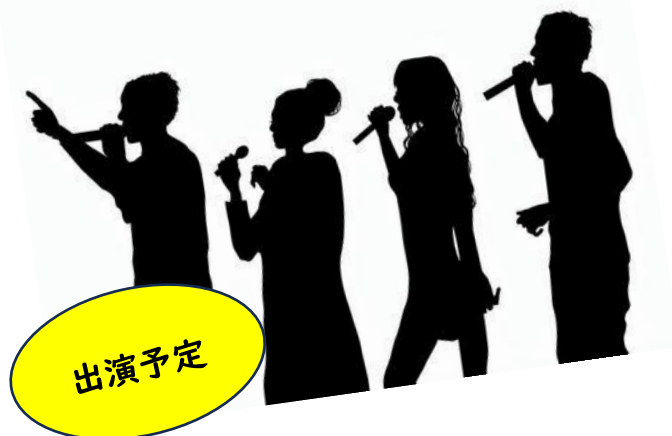
学生アカペラサークル