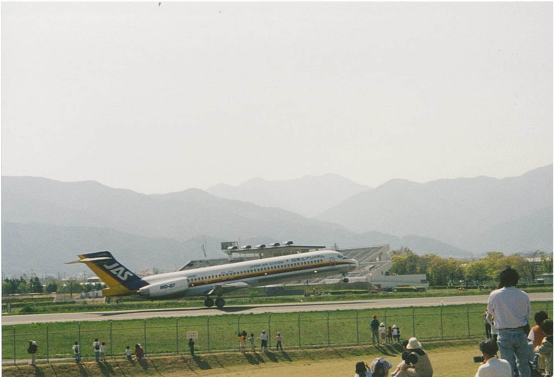
飛行場と陸上競技場（十数年前）