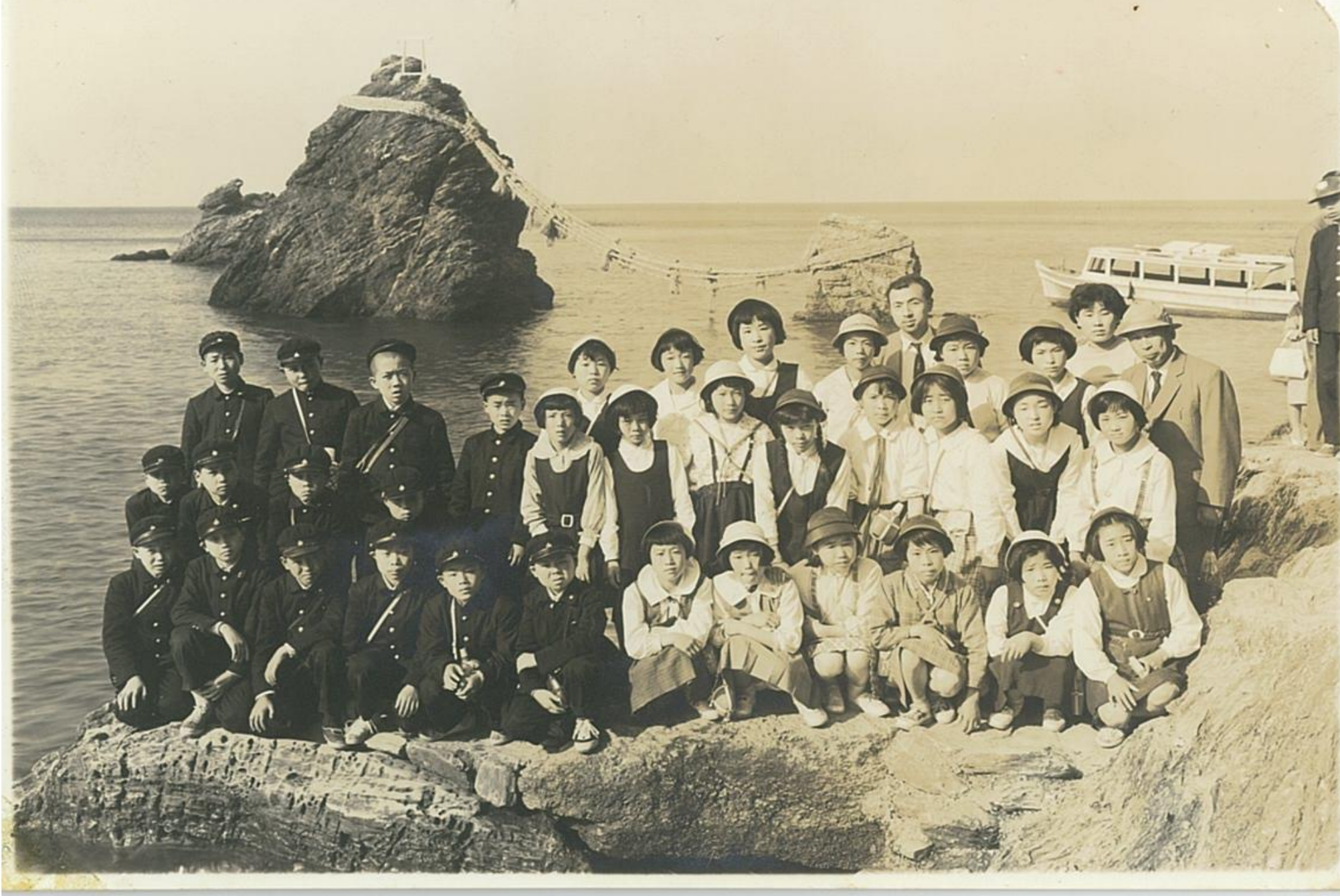
旅行の思い出（昭和30年代前半）