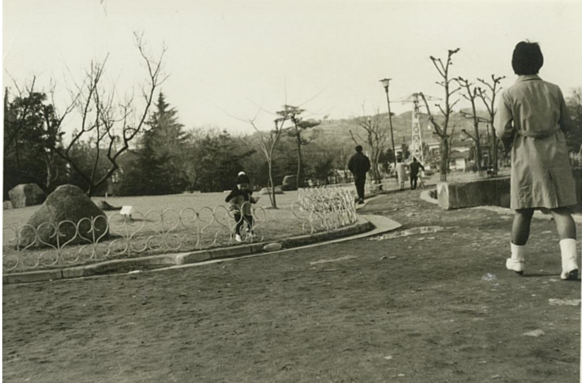
松本城の遊園地（昭和40年はじめ）