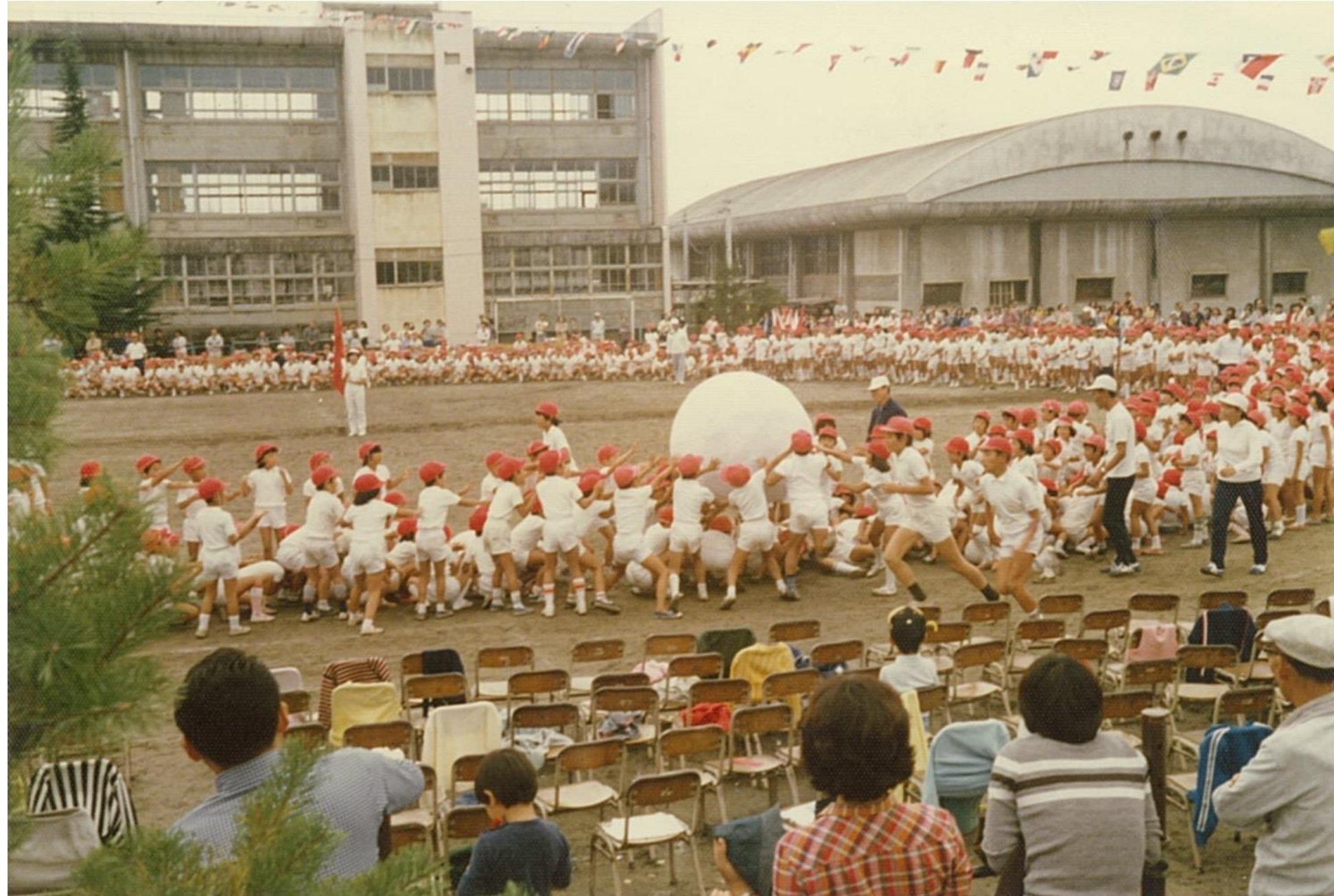
開智小学校運動会（平成2年頃）