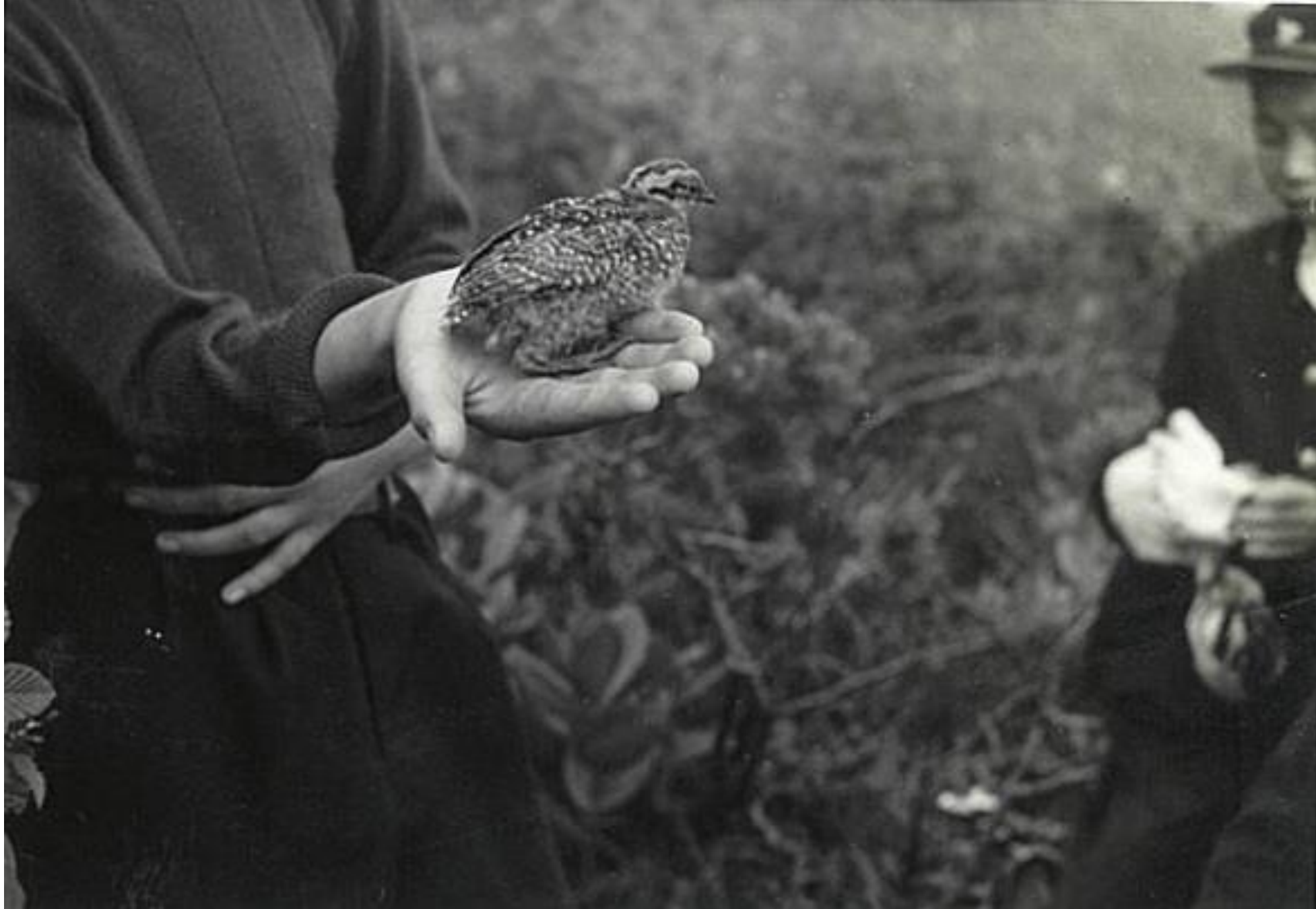
乗鞍岳の雷鳥（昭和36年）