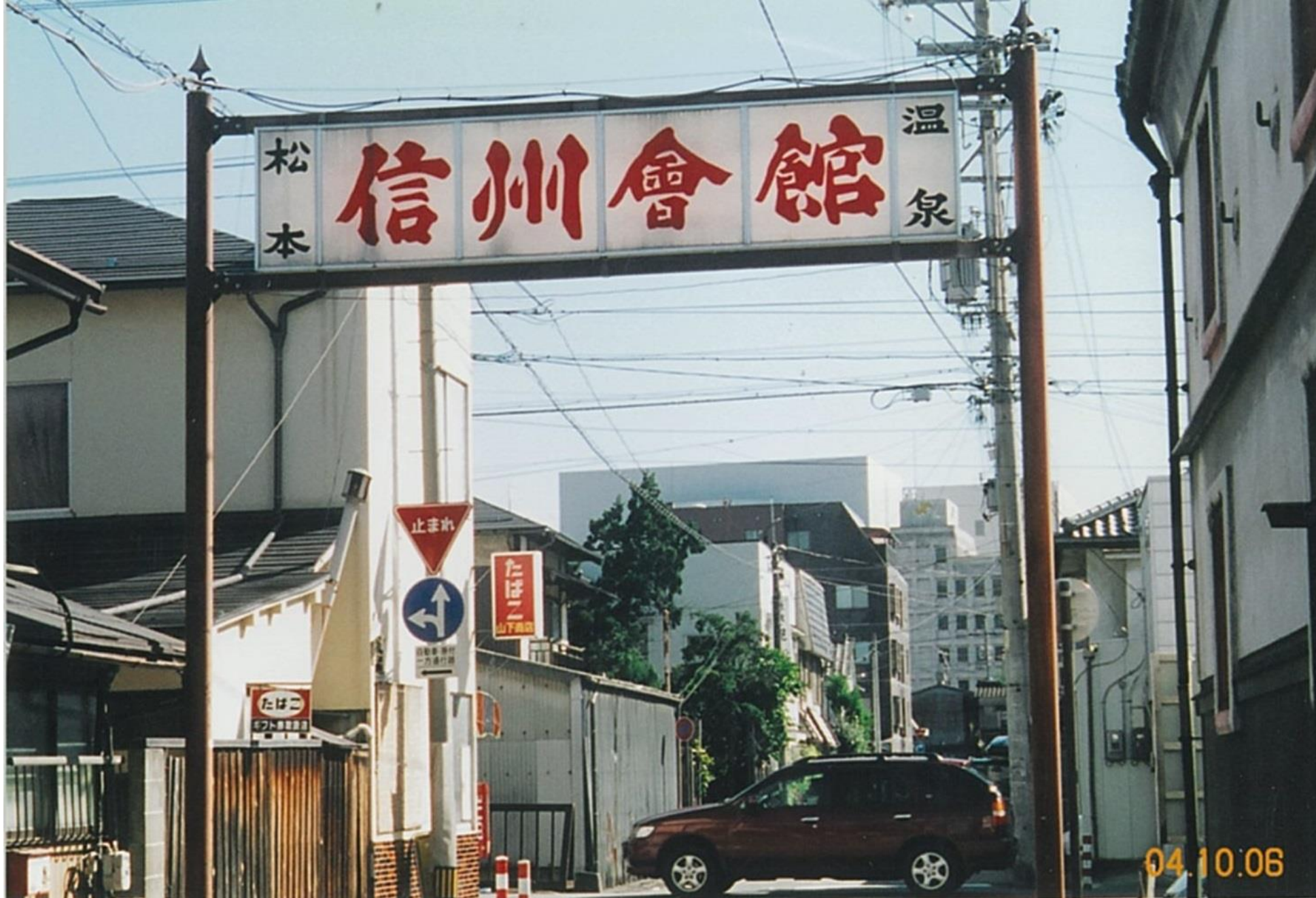
西堀 信州會館看板 (平成4年)