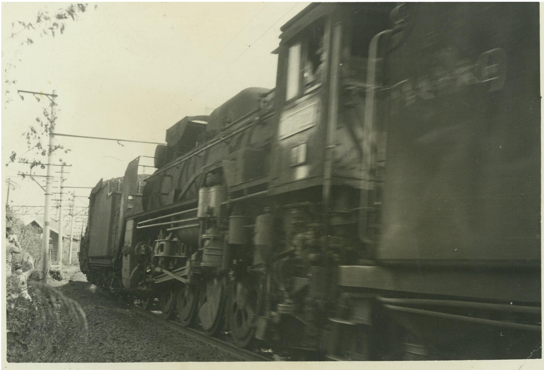
デコイチ = 南松本駅？（昭和40年代前半）