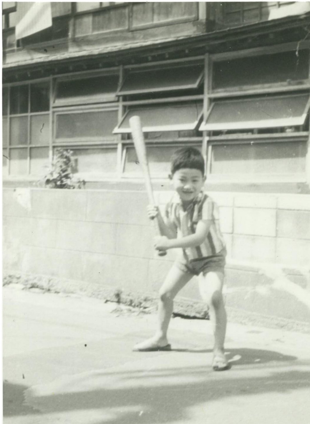
バットを振る少年（昭和40年代前半）