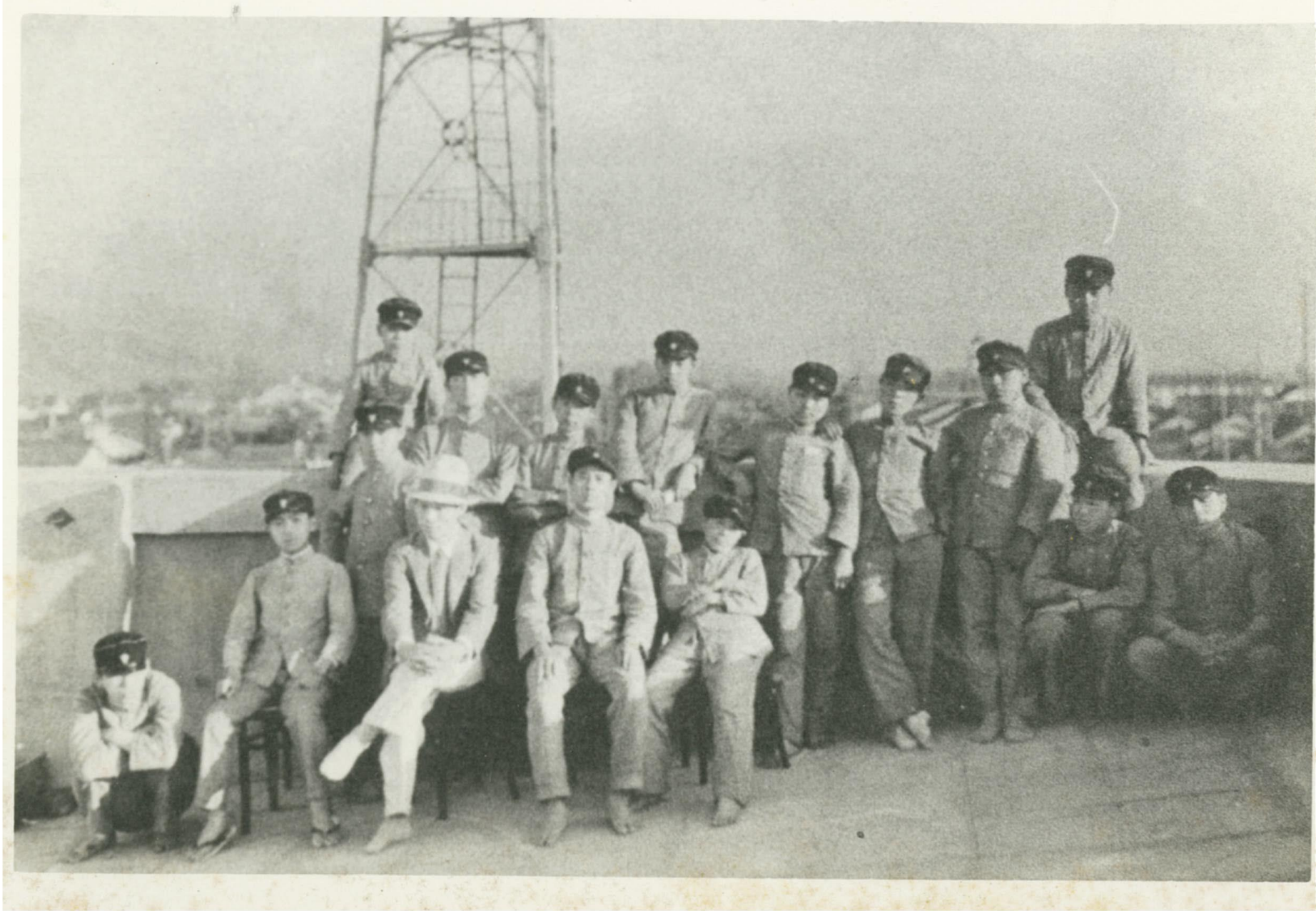
松本商業高等学校の学生＝鶴林堂の屋上にて（大正後期～昭和初期頃）