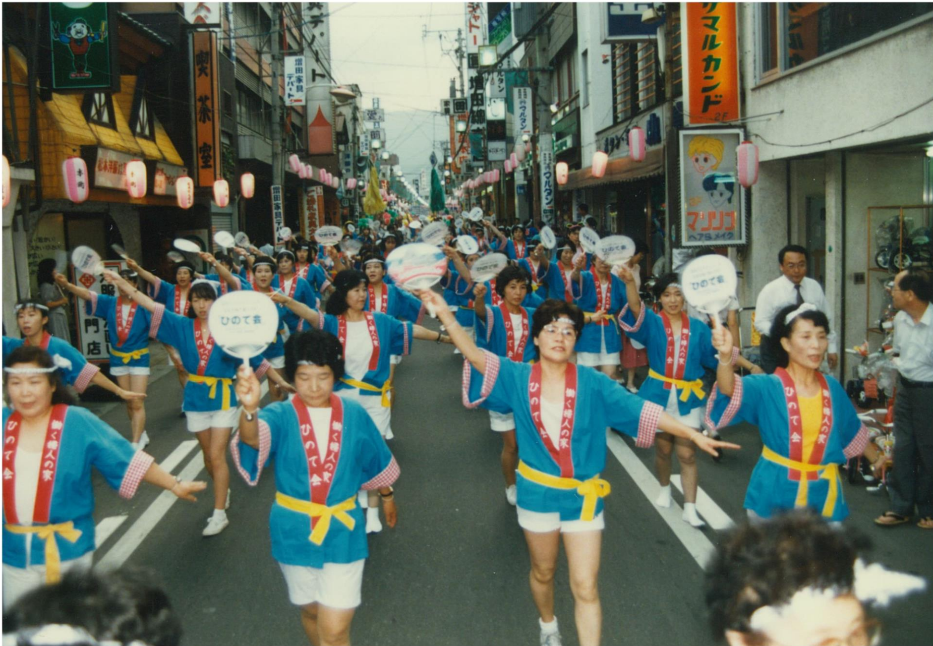
開催初期の松本ぼんぼん（昭和50年代前半）