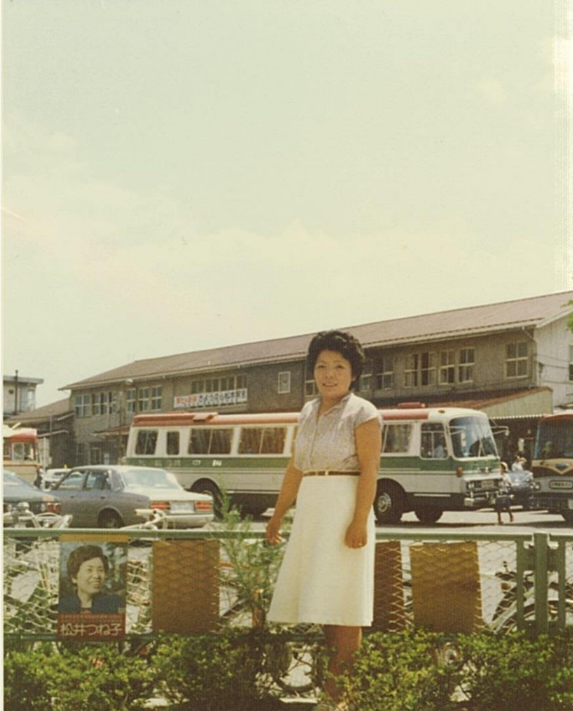
建て替え前の松本駅（昭和53年頃）