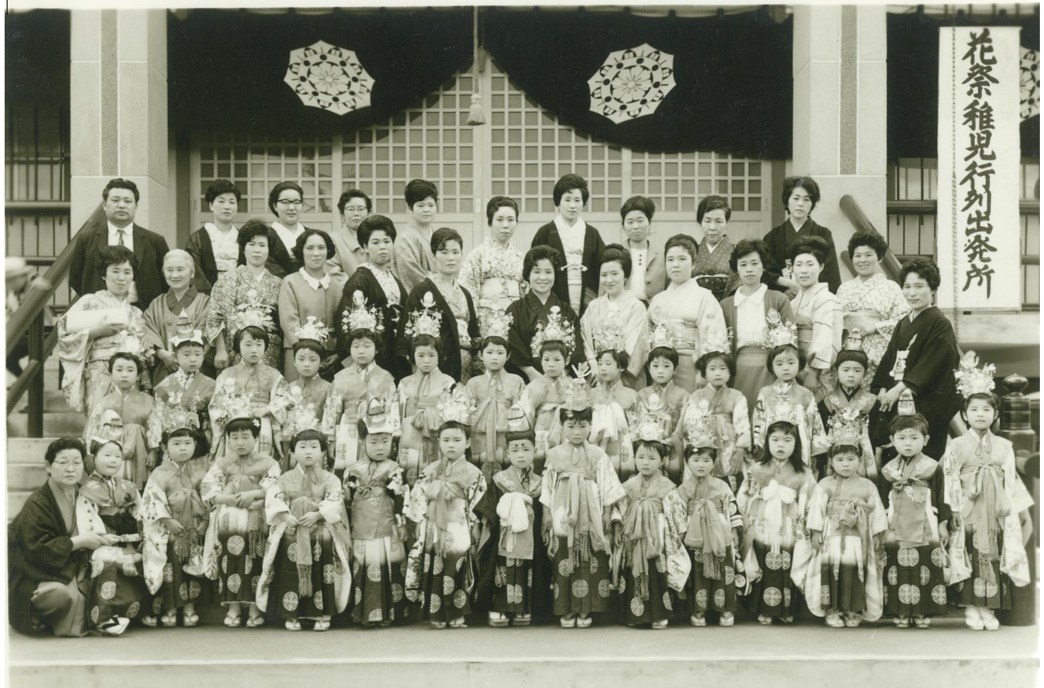
花まつりの稚児たち（昭和40年）