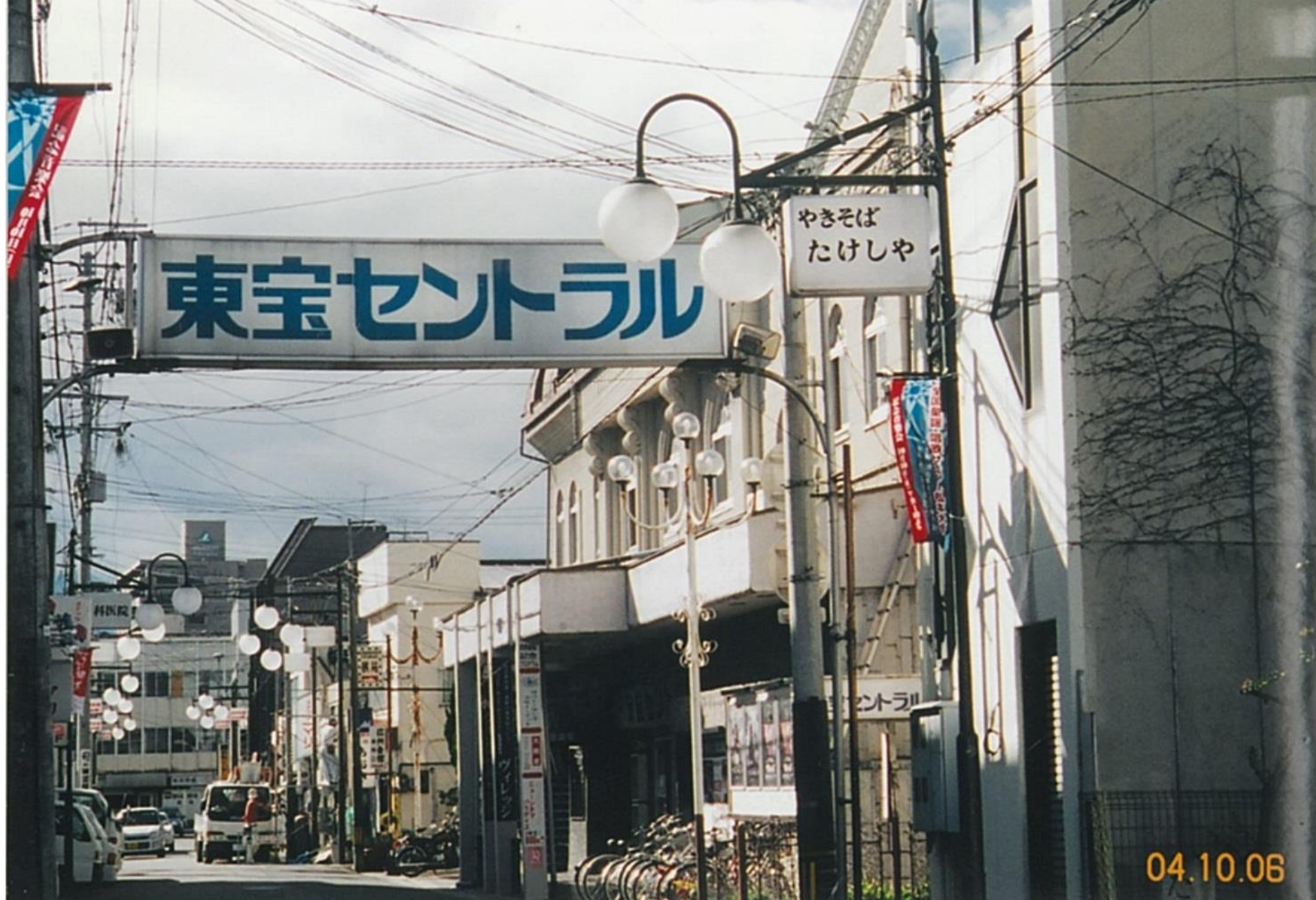
西堀 東宝セントラル看板 (平成4年)