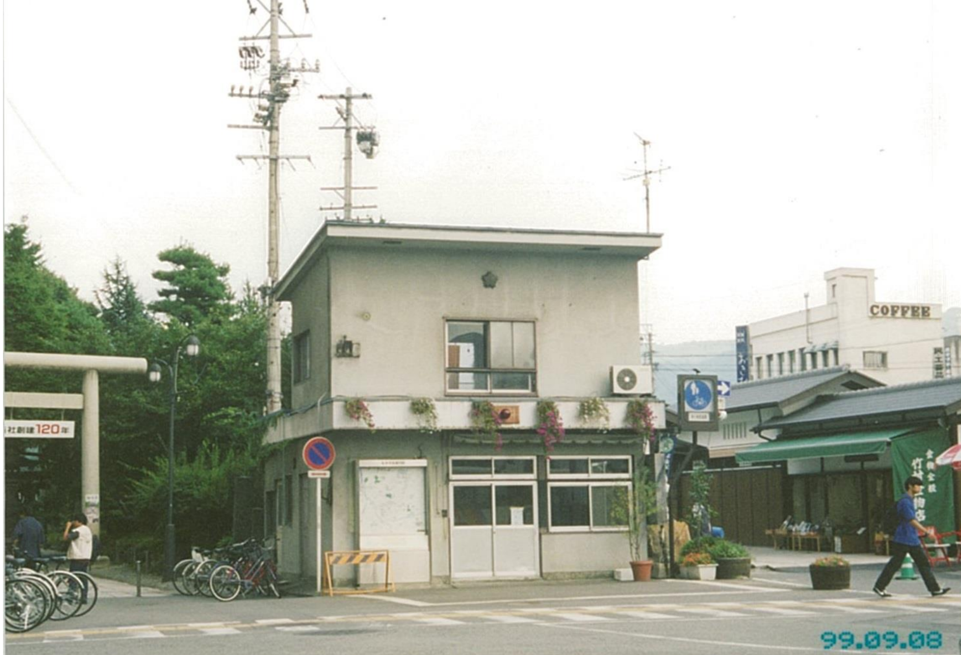
ナワテ通り入口 大手交番（平成11年）