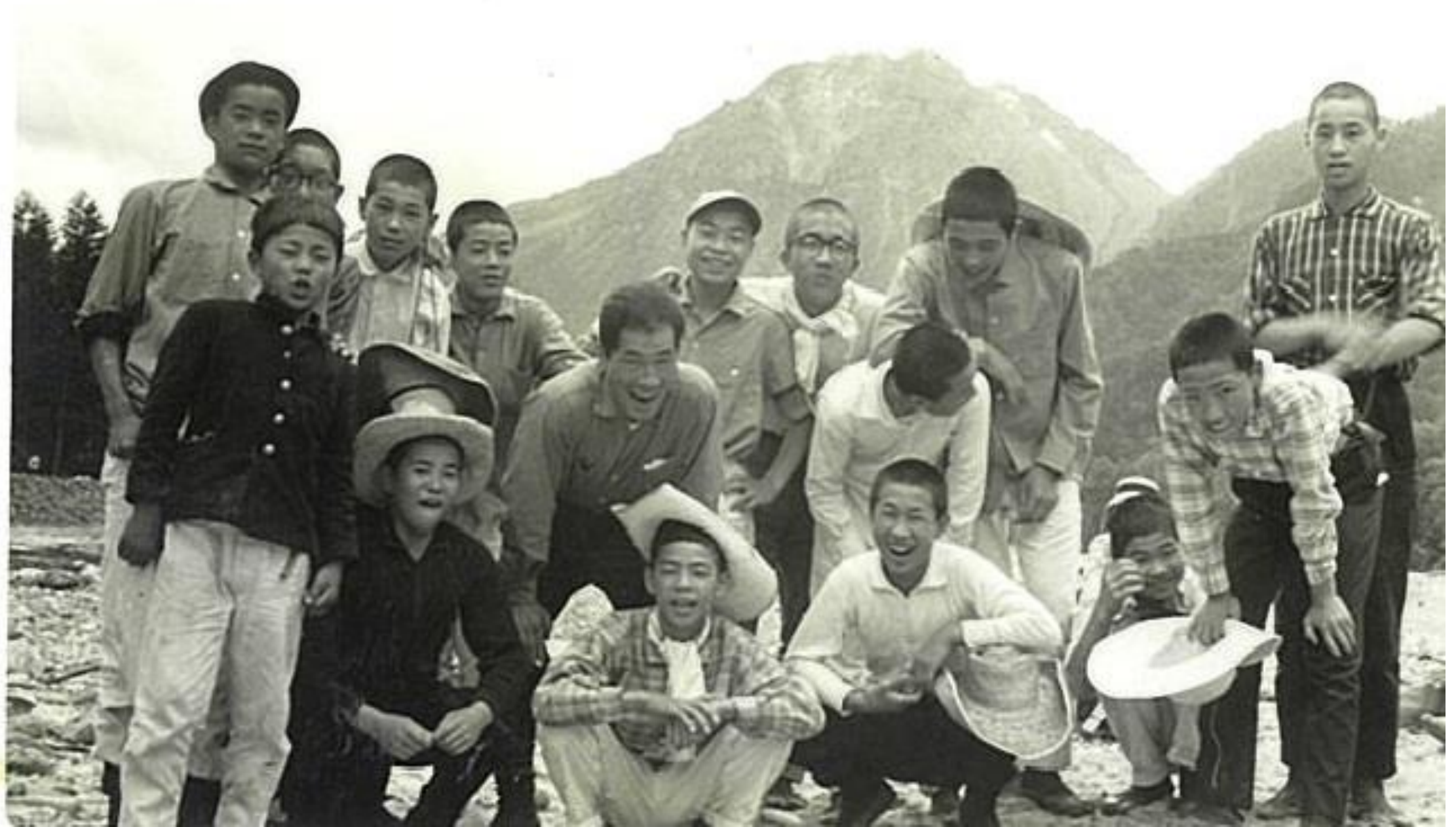
上高地・焼岳をバックに（昭和30年代後半）