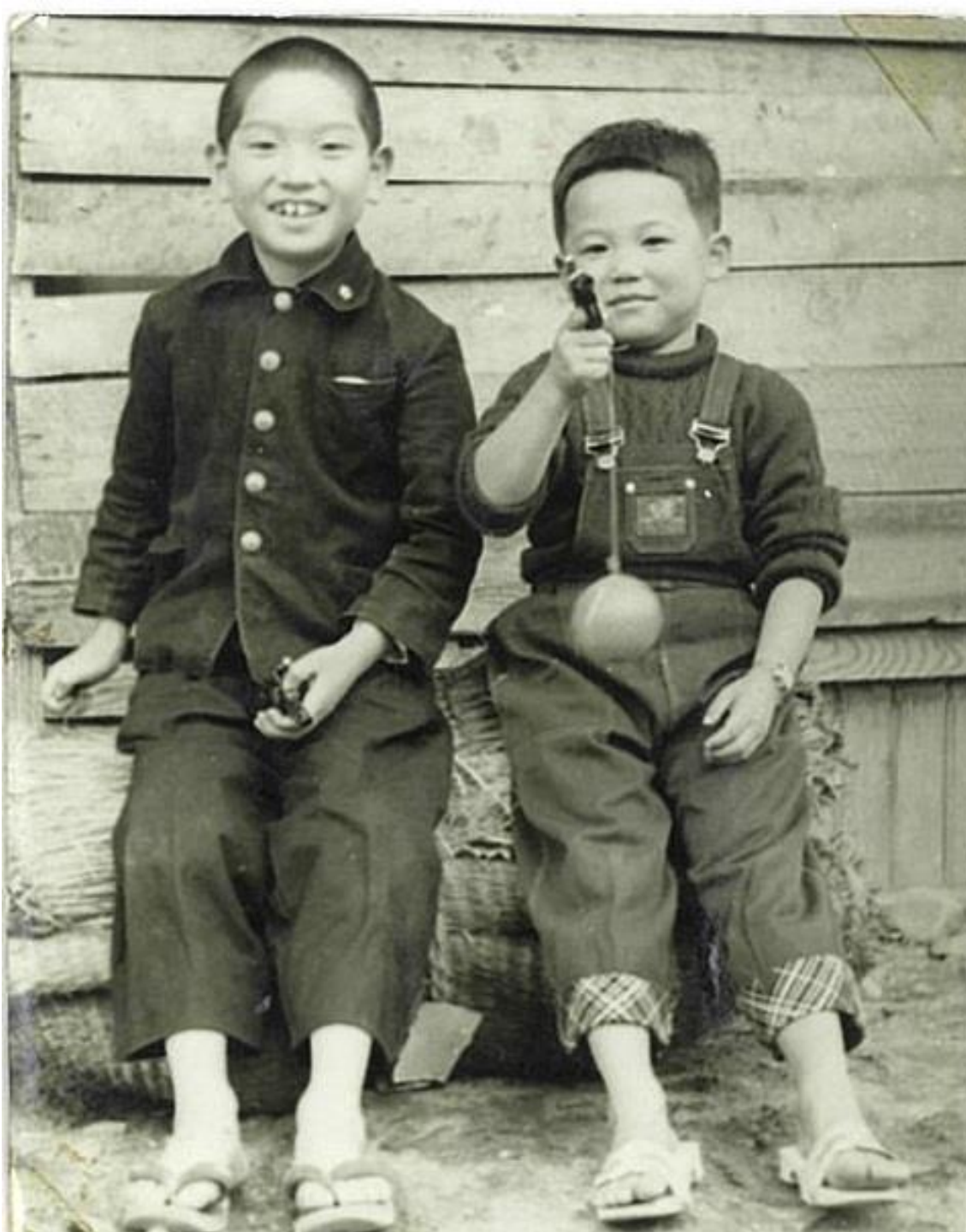
仲良し (昭和20年代後半～30年代前半)