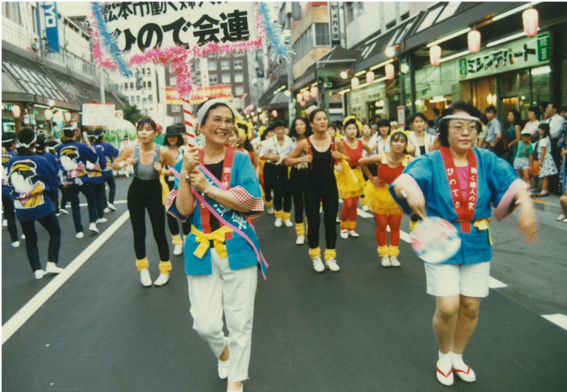
開催初期の松本ぼんぼん（昭和50年代前半）