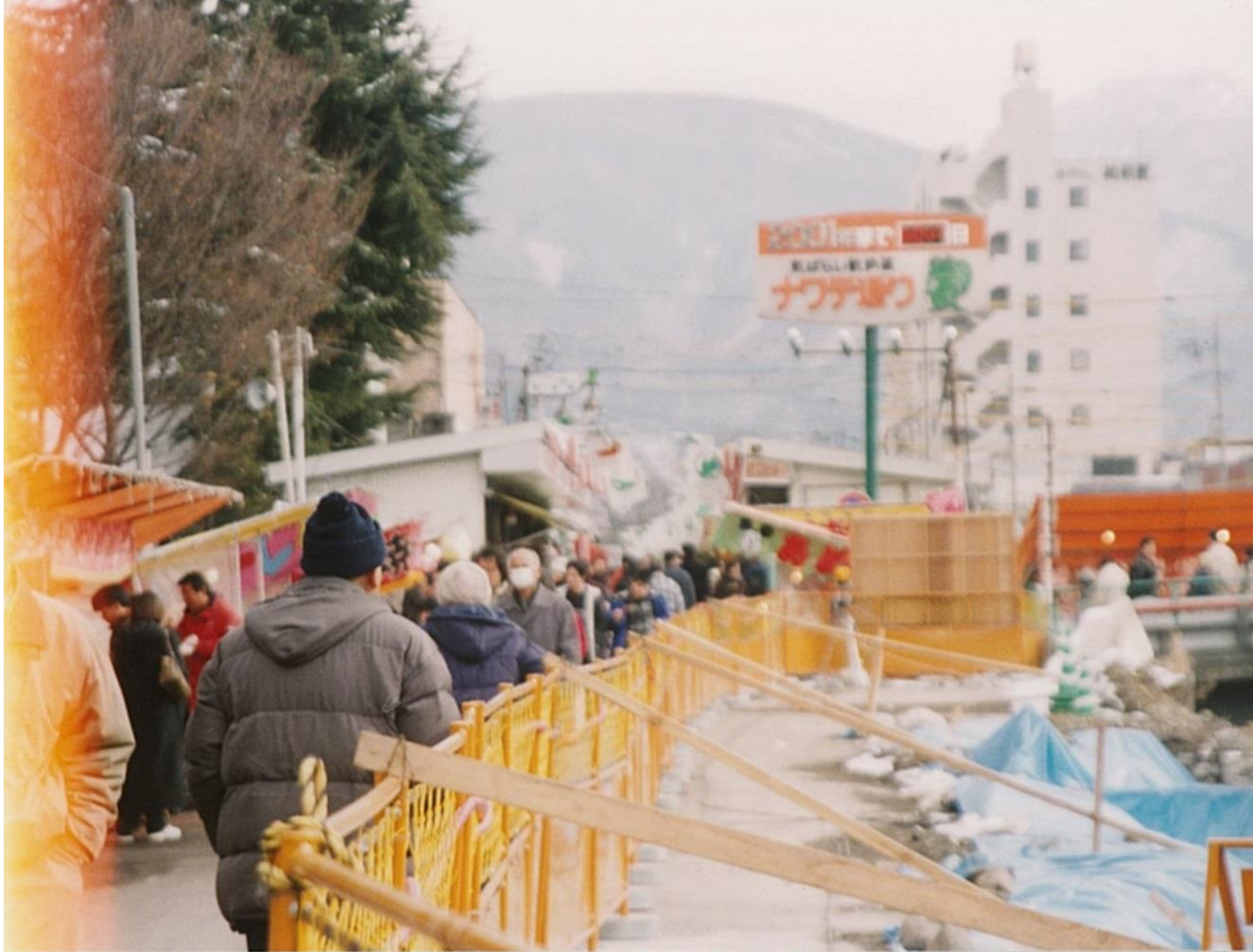
ナワテ通り（平成12年）