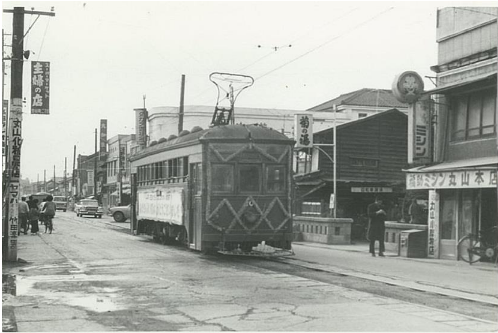
思い出の市内電車①