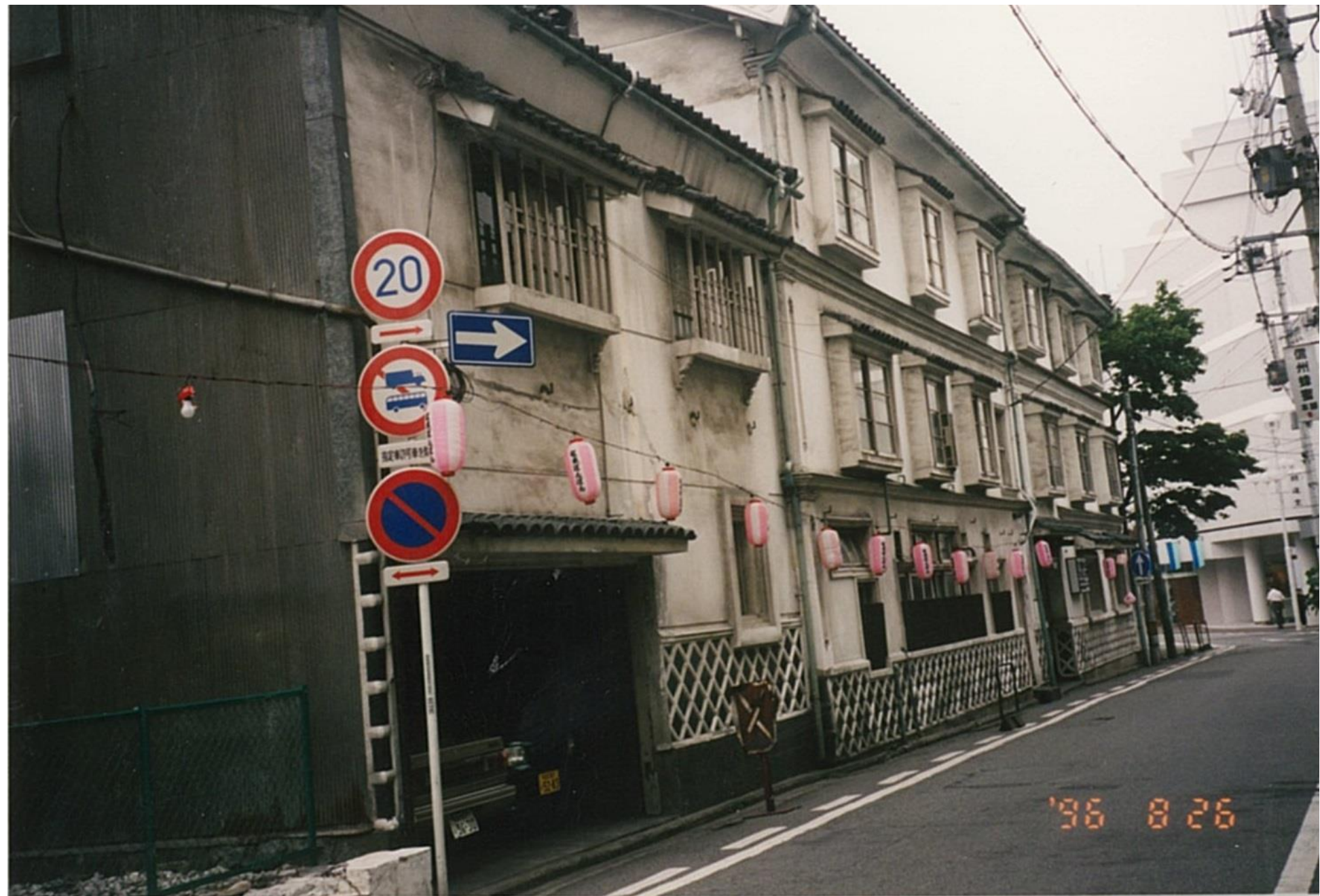
パルコ周辺②いちやま旅館（平成8年）