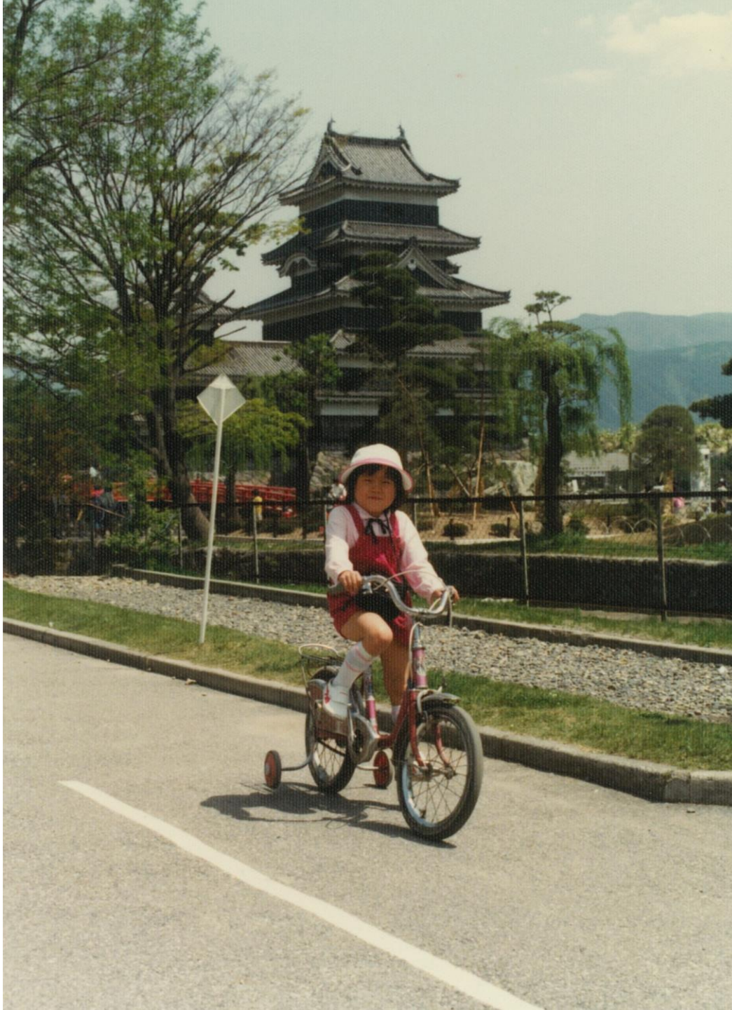
お城と自転車（昭和57年）