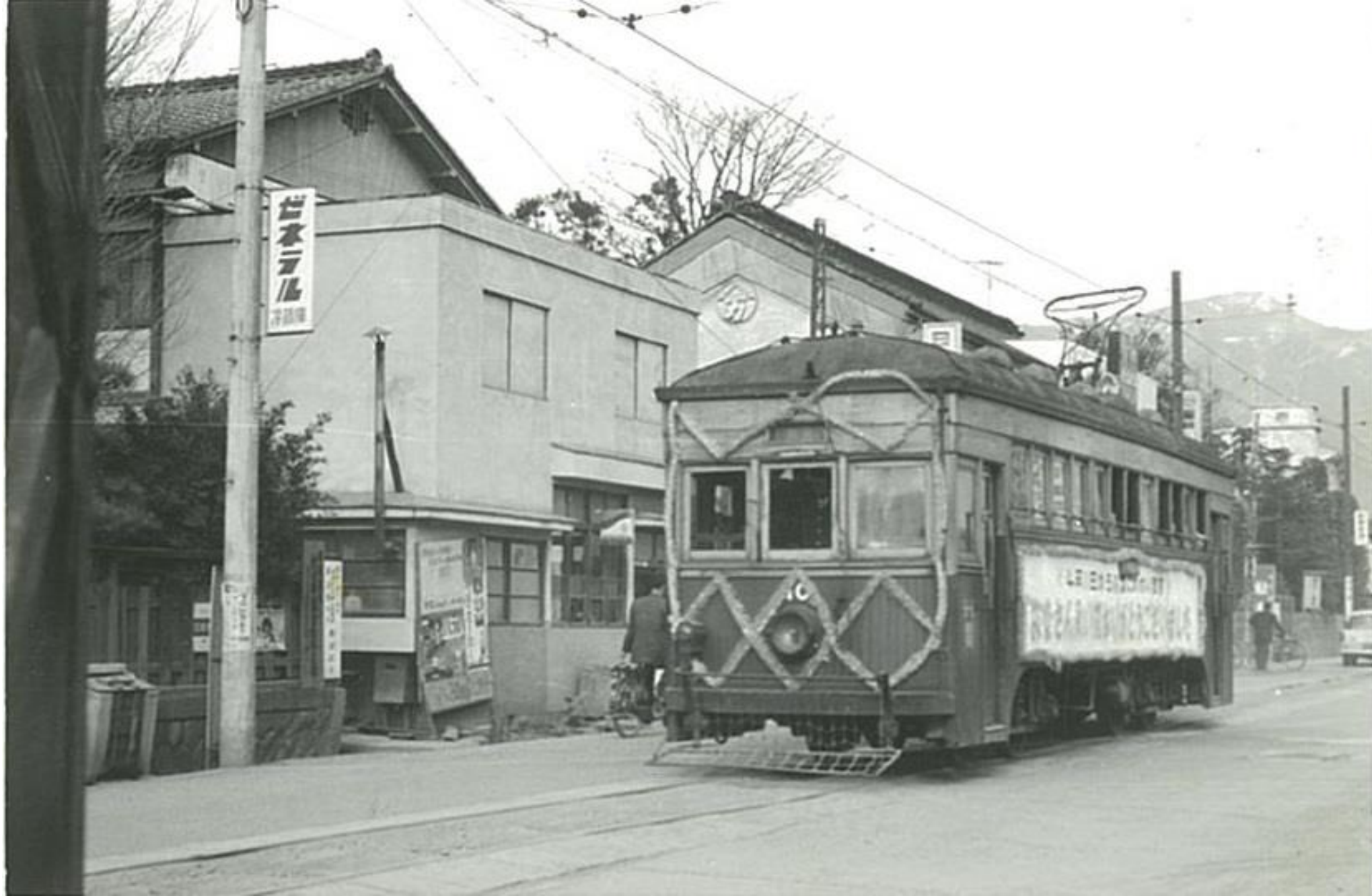
思いでの市内電車②