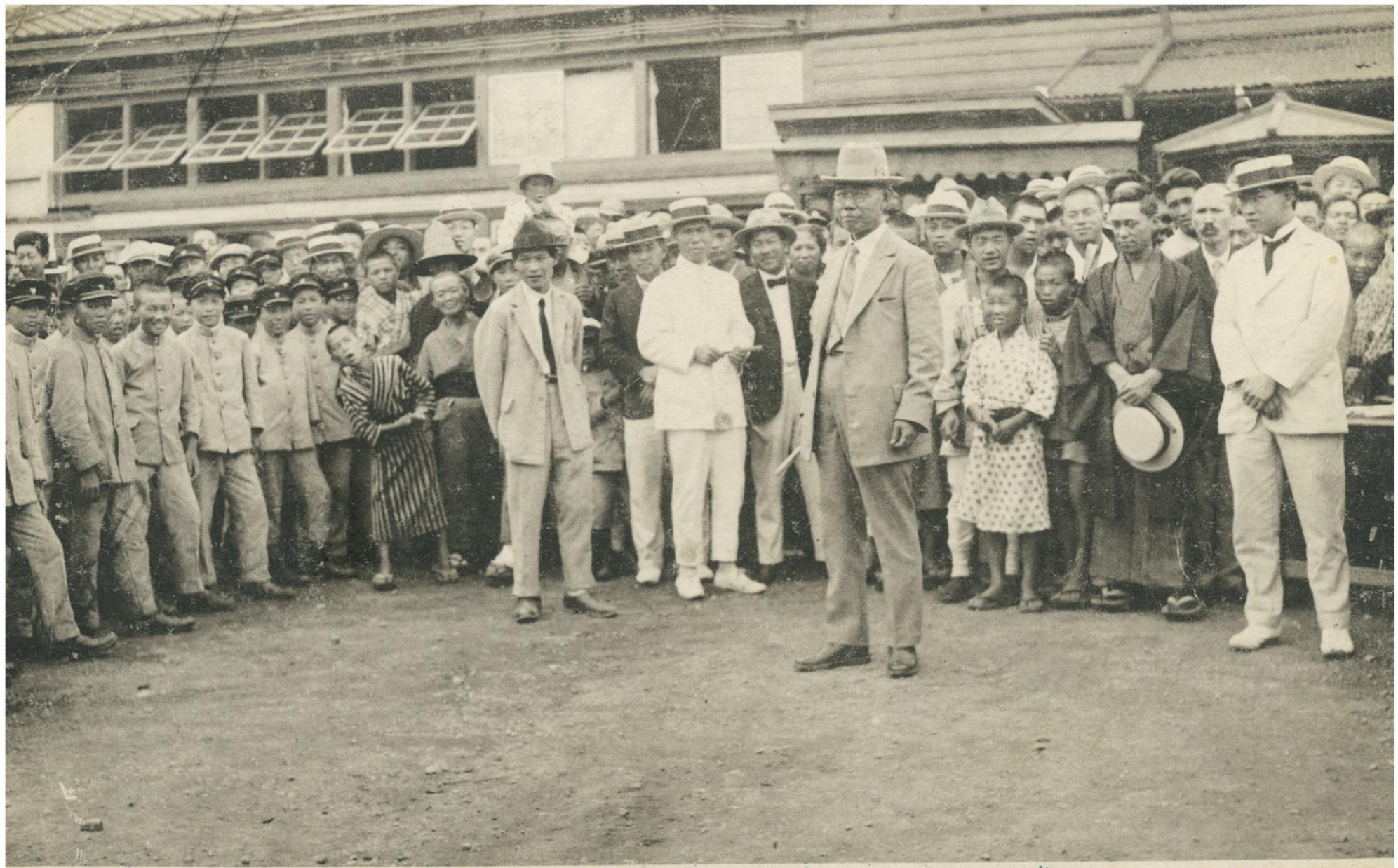
(製店崙窠岡松十ヶ上)