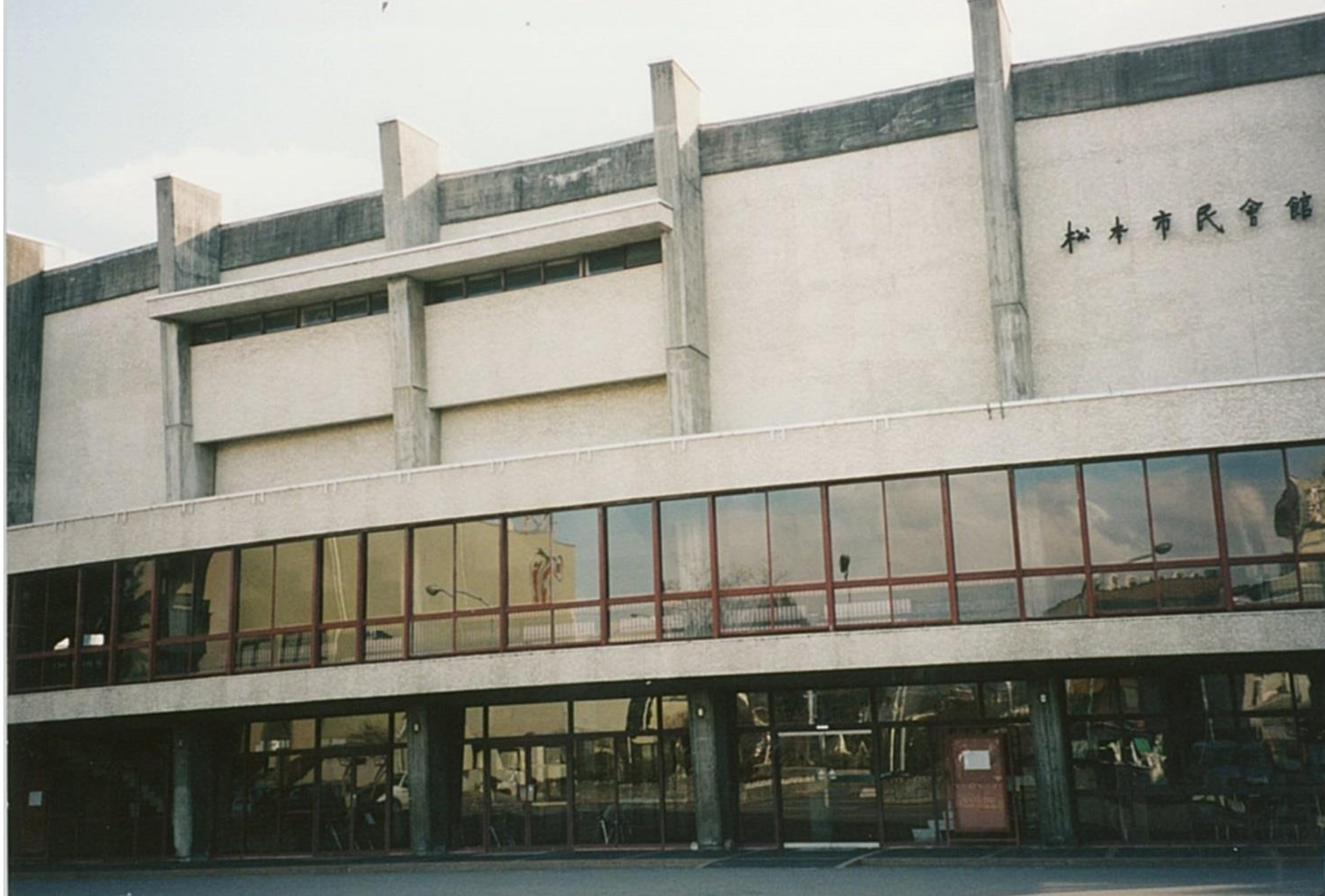
松本市民会館（建て替え前）