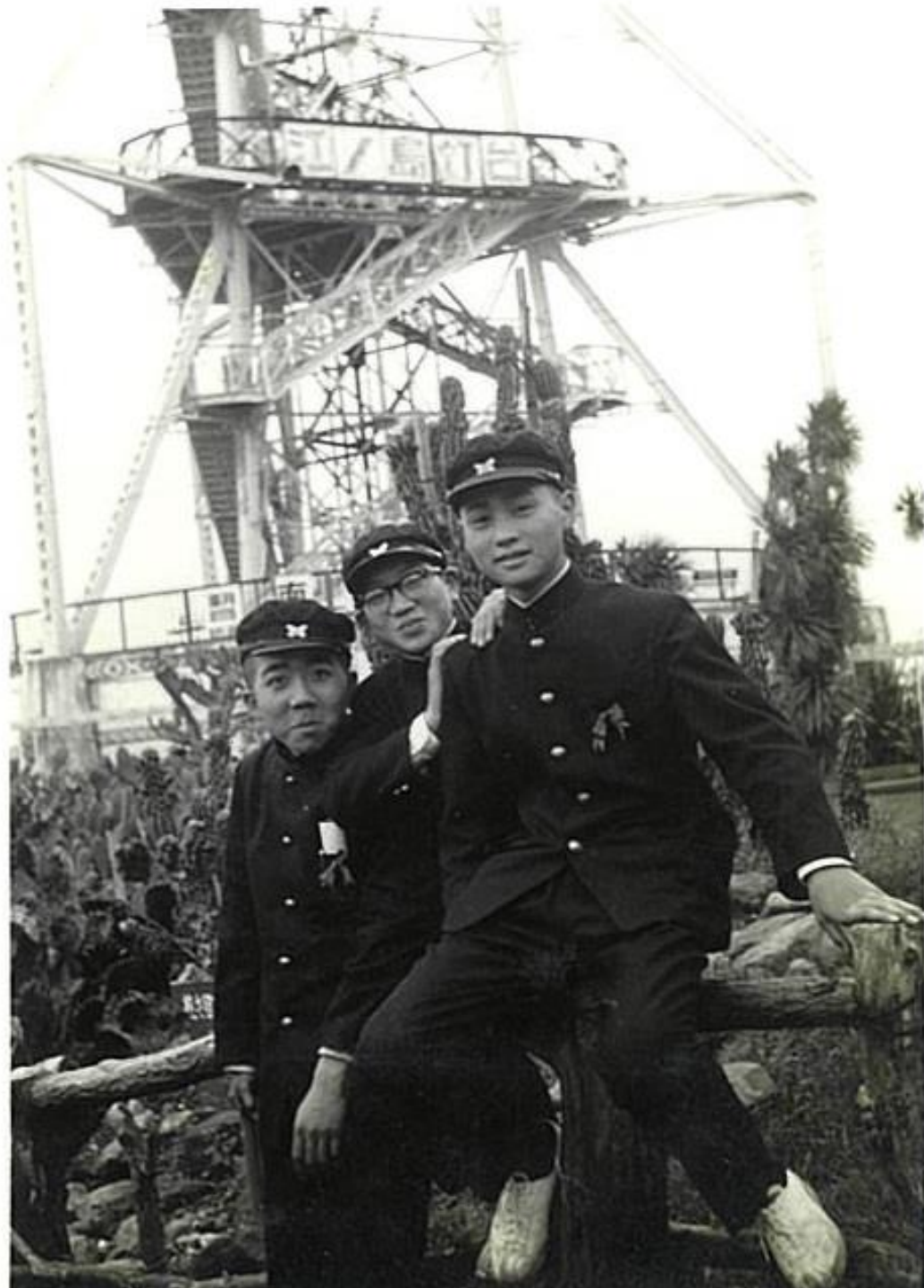
江ノ島灯台前（昭和30年代後半）