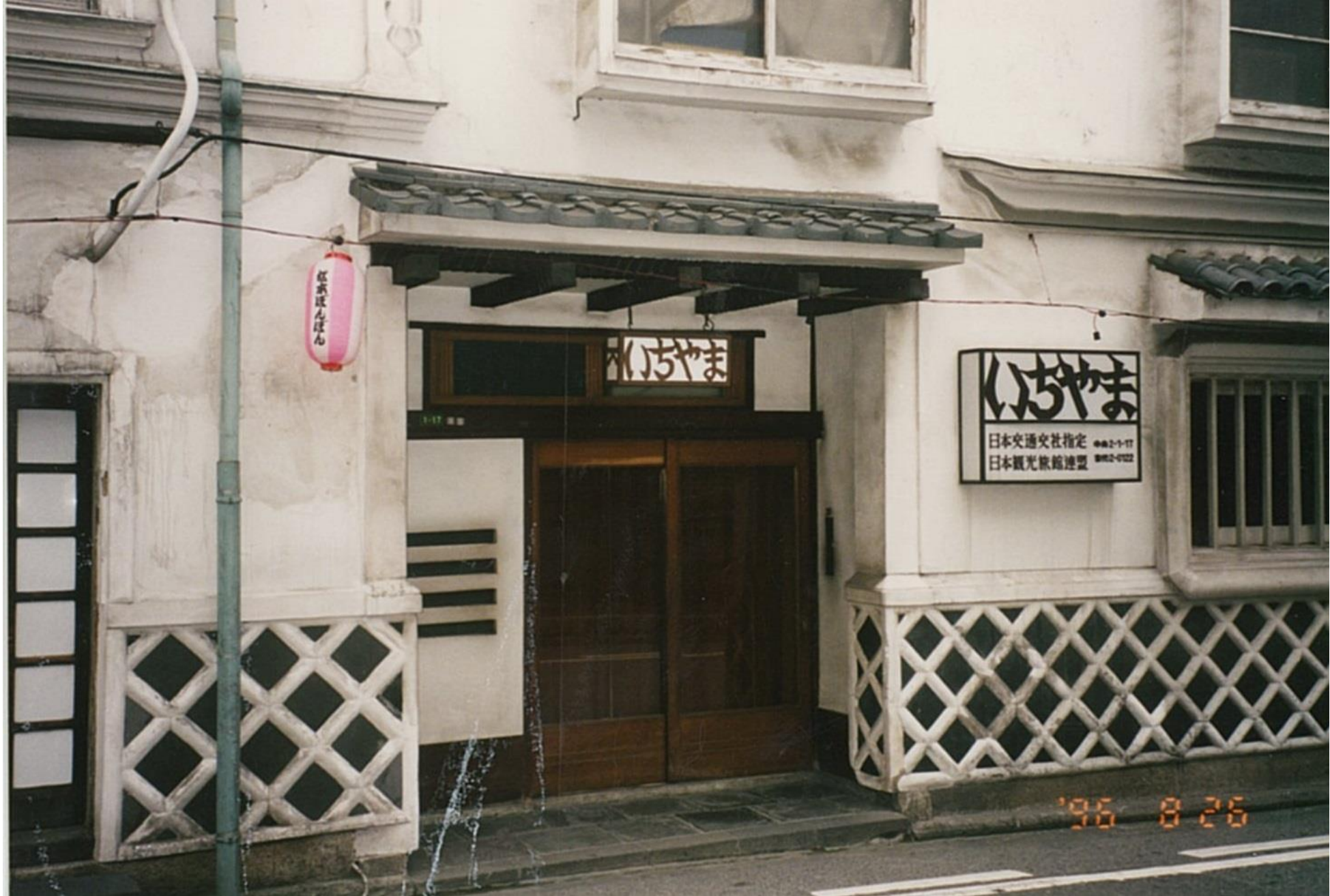
パルコ周辺①いちやま旅館（平成8年）