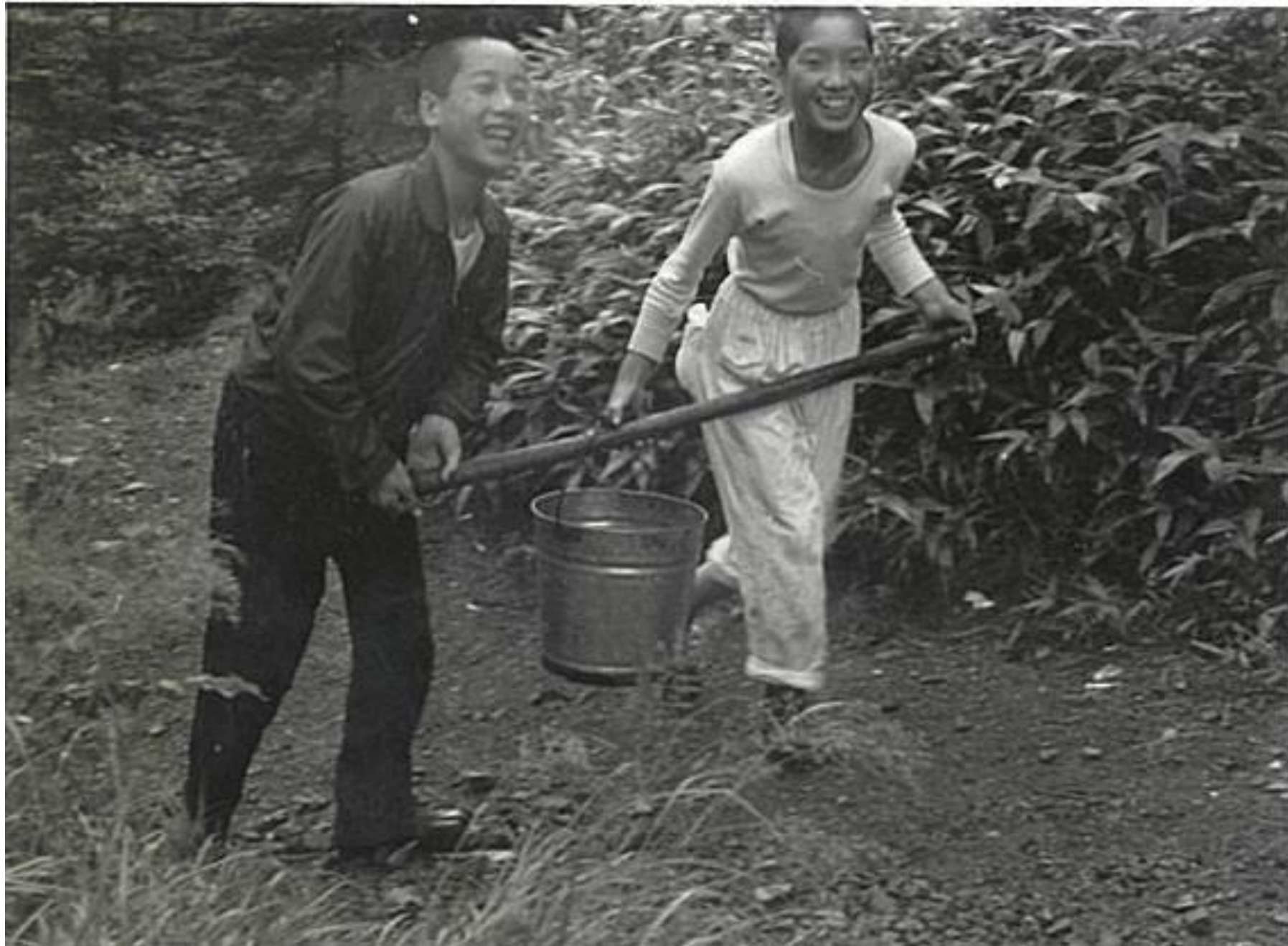
畑の水をバケツで運ぶ少年（昭和30年代前半）