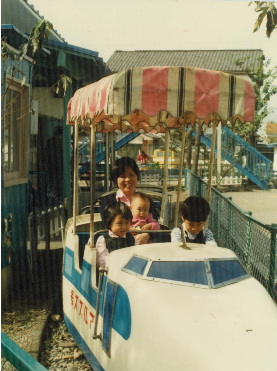
松本城・児童遊園地の豆電車（昭和57年）