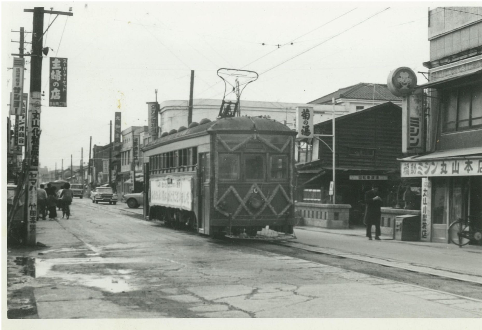
チンチン電車 運行最終日（昭和39年3月31日）