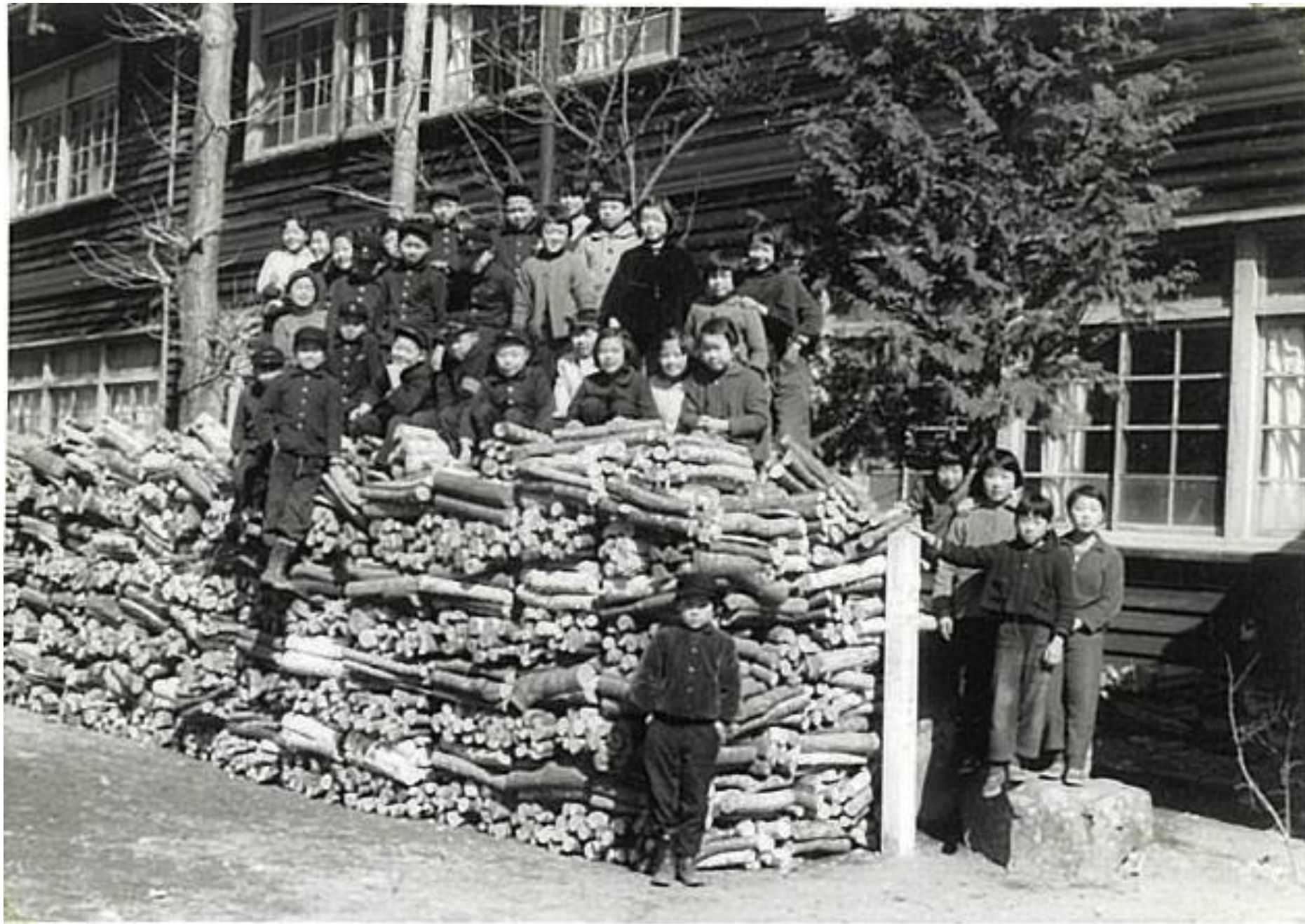
薪の上（昭和30年代前半）