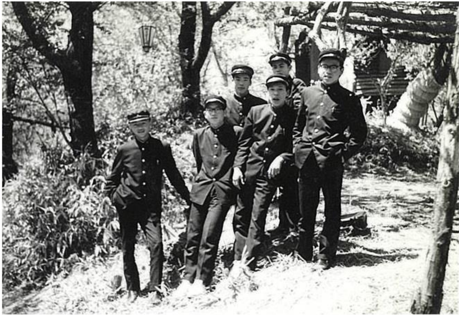
仲間たちと（昭和30年代後半）