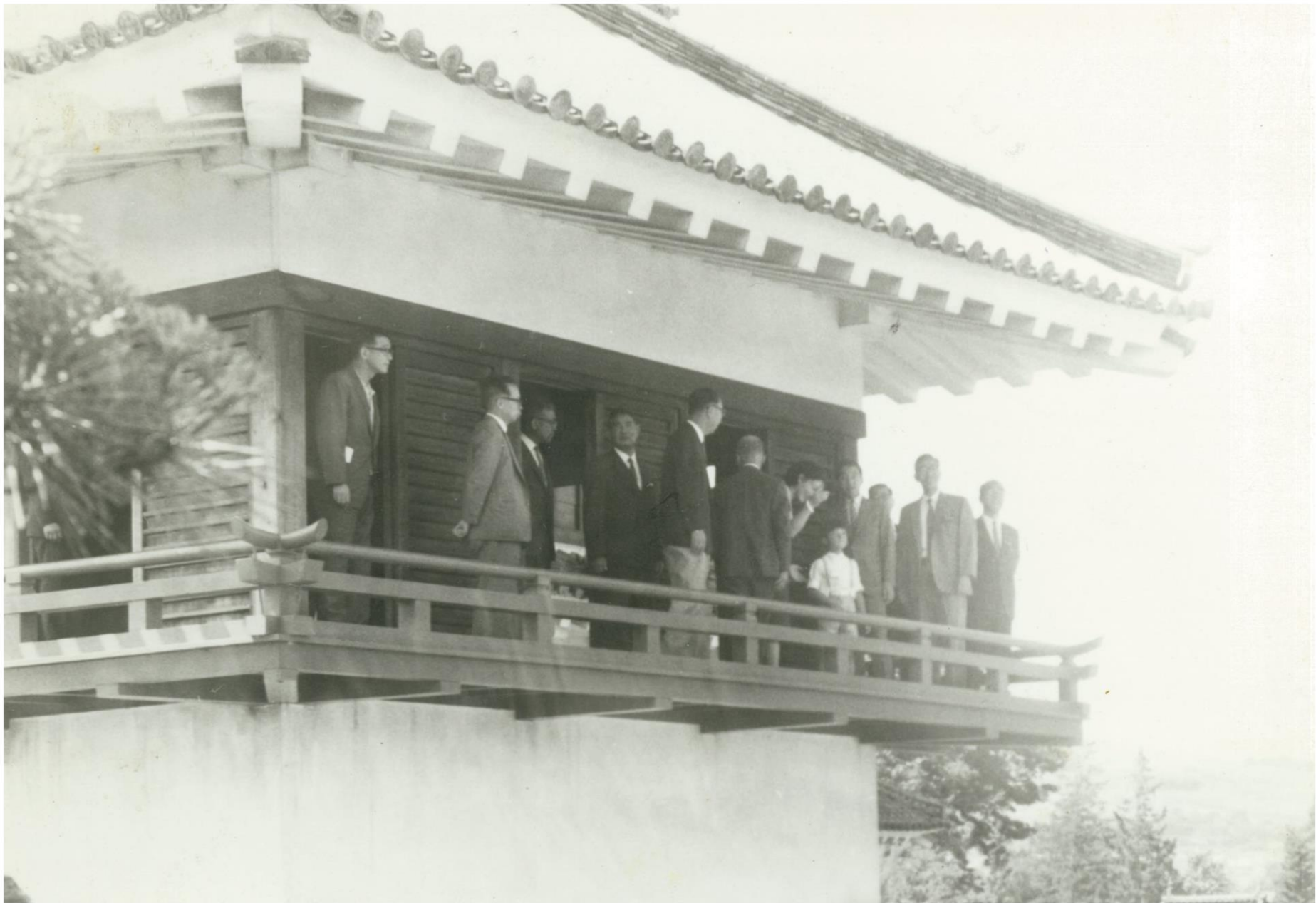
幼少の天皇陛下と美智子上皇后陛下＝松本城にて（昭和42年）