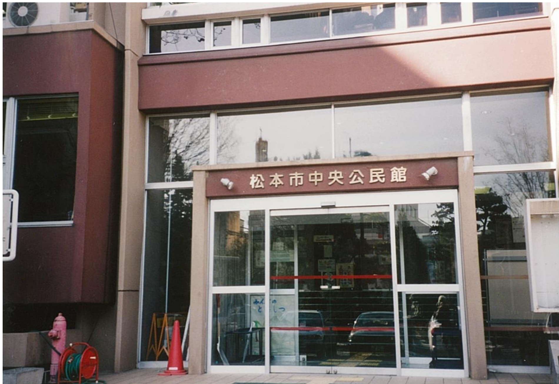
松本市中央公民館（平成11年）