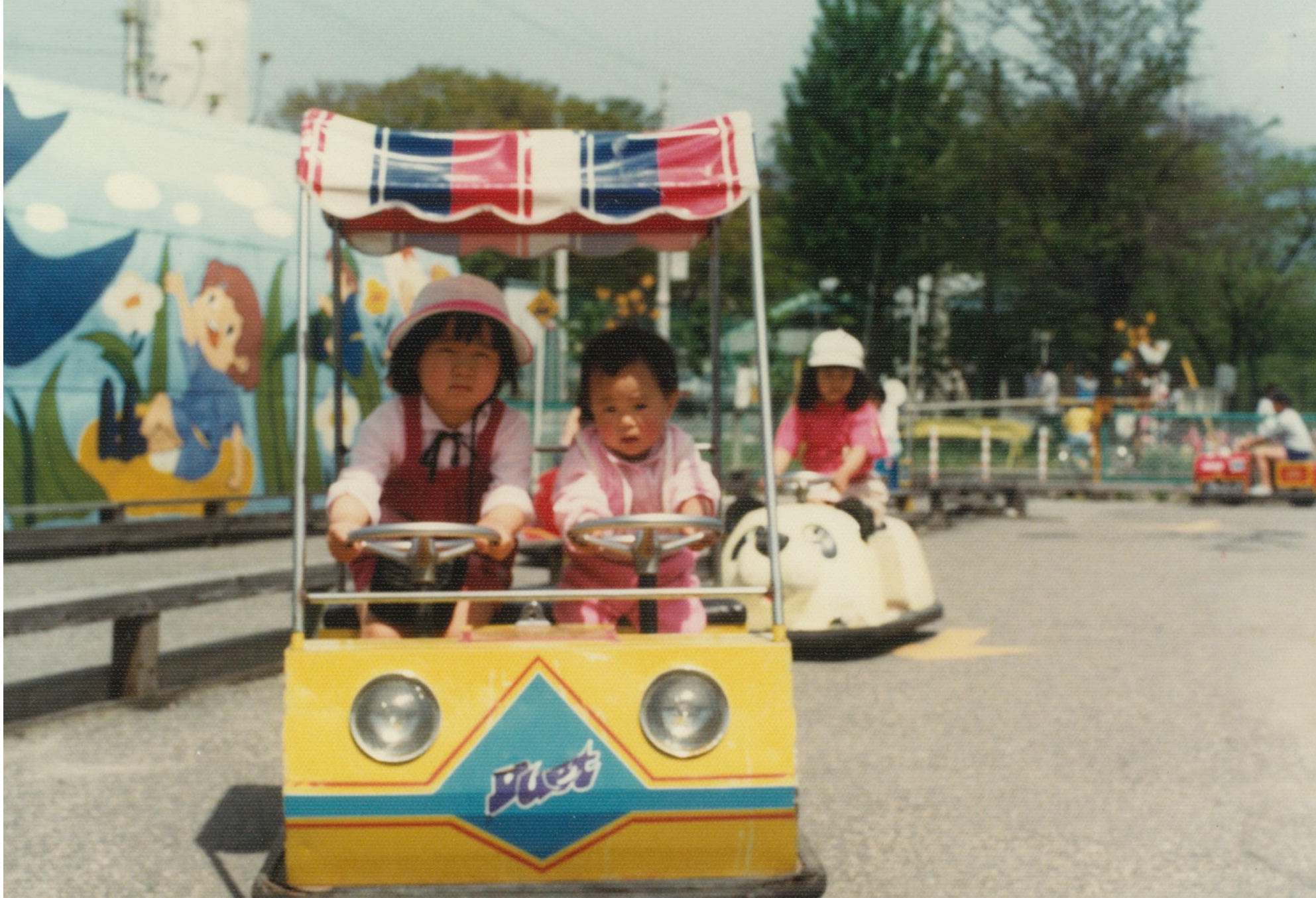
松本城・児童遊園地の乗り物（昭和57年）