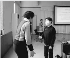
参加者同士でコミュニケーションを体験しました。

人とのかわりには、コミュニケーションが大切。しかし、コミュニケーションには限界があります。同じ説明でも人それぞれ感じ方や受け取り方は異なるため、内容を伝えるときは具体的に、時には発想の転換をすることも大切だと学びました。今後の活動に役立てていきたいです。