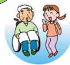
高齢者・障がい者