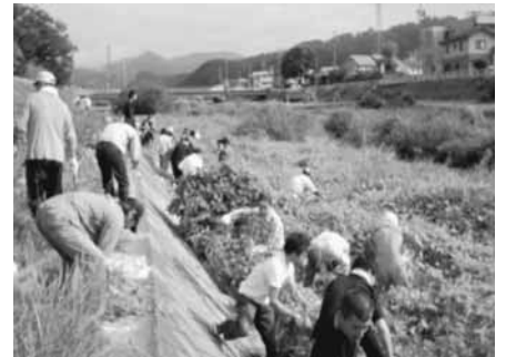
㈱日邦バルブの皆さん

うちの会社でも！とボランティア活動に関心のある企業がありましたら、ぜひボランティアセンターにご連絡ください。