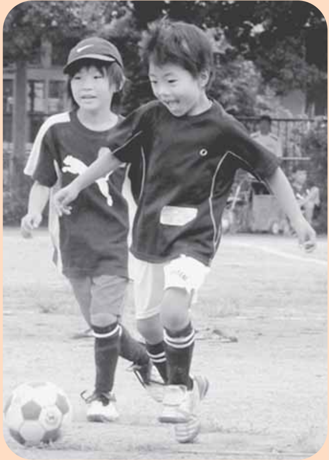
サッカーを通して仲間の大切さを知り、喜びを分かち合う (松本エス・ティール少年サッカースクールの児童)