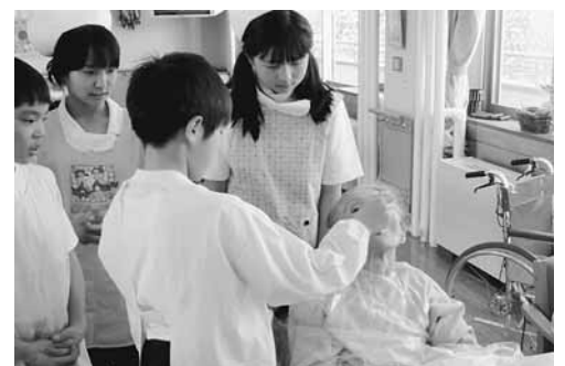
附属松本小学校児童の看護体験