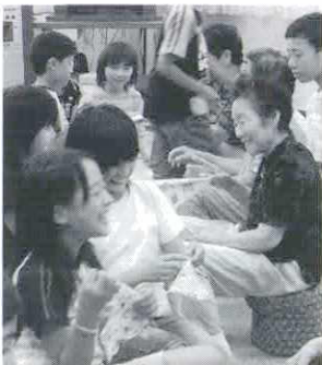
小学生との交流風景

「子どもたちにあいさつをすると、あいさつが返ってくるようになった。」という交流の成果が表れている様子も聞かれ、このような交流活動が近年よく言われている、人と人とのつながりの希薄さの改善や、地域の安全の向上にも役立っています。このように子どもとの交流を深めることでお互いに顔見知りになり、普段の見守り活動にもつながっています。