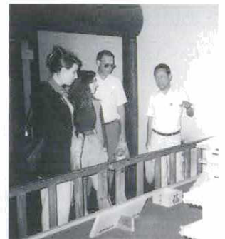
得意の英語でガイドボランティア