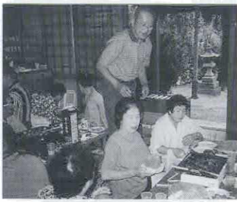
打ちたてのそばで交流

一人暮らしの高齢者に配食をしたり、庭の草取りをしたりしながら、これからはお互いに励まし合って高齢社会を乗り切ろうと意気込んでいます。