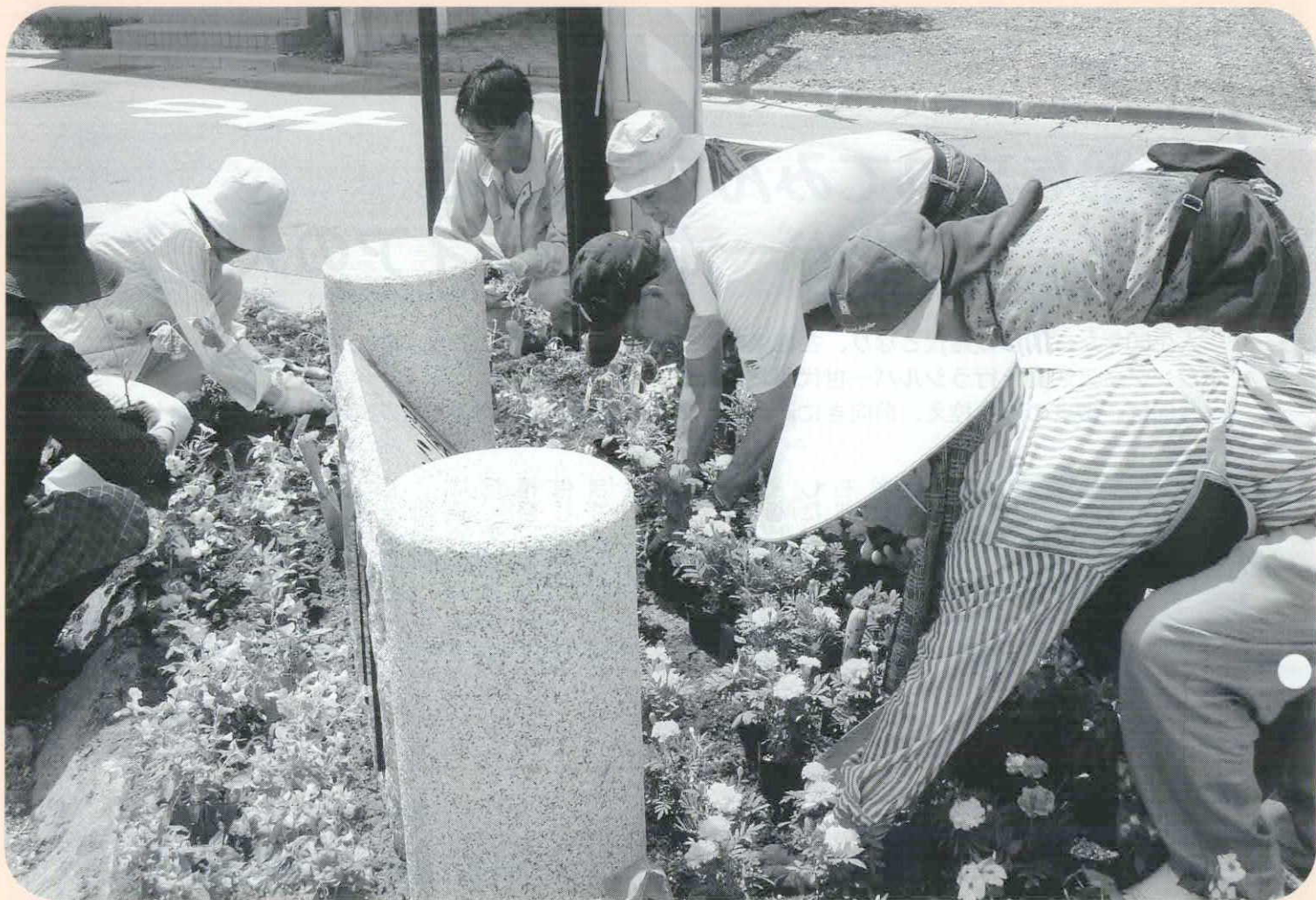
花壇づくりに精を出すボランティア