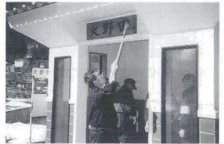
バス停や公共トイレを清掃

活動が負担になりすぎず、できる範囲で地区のお役に立ちたいと考えています。「無理せず、楽しみながら」が私たちのモットーです。